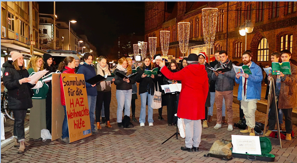
Flashmob auf dem Weihnachtsmarkt Hannover 12/23